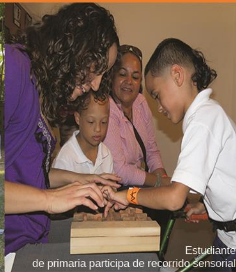
Estudiante de primaria participa de recorrido sensorial