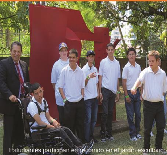
Estudiantes participan en recorrido en el jardín escultórico

Artes visuales y currículo escolar Fomentando las destrezas del siglo XXI ENERO – MAYO 2014