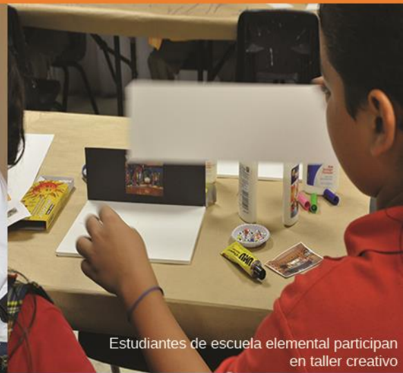
Estudiantes de escuela elemental participan en taller creativo

Se promueve un mayor aprovechamiento académico a través de recorridos interpretativos y talleres creativos que fomentan destrezas como: